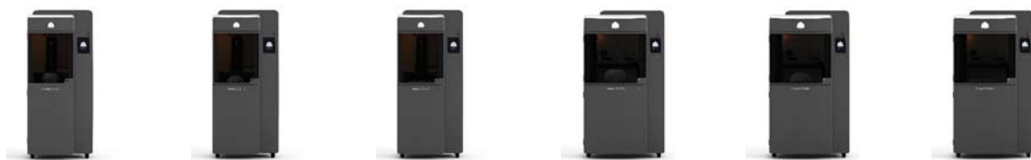
ProJet® 6000 SD ProJet® 6000 HD ProJet® 6000 MP ProJet® 7000 SD ProJet® 7000 HD ProJet® 7000 MP